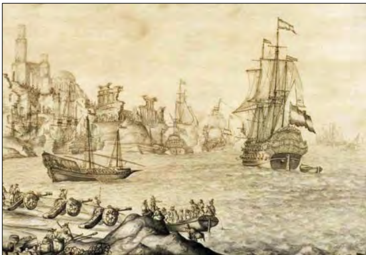
1674 Vloot van Evertsen in de haven van Cadiz

Evertsen, maar uit de bekende literatuur kan worden opgemaakt dat Evertsen zich op dat moment inderdaad in Cadiz bevond.