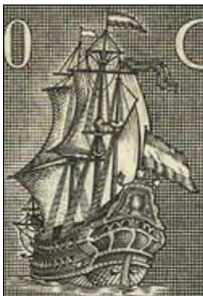
1934 Walbeek zegel, detail