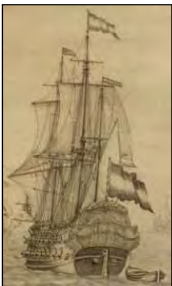
Detail van het schilderij van Pieter Vogelaer

Als je naar beide schepen kijkt, zie je inderdaad ook hier een duidelijke overeenkomst, alhoewel de achterstevens verschillen vertonen.