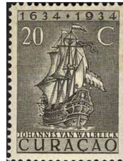
Curaçao Van Walbeek 1934

In het Maandblad van januari 1934 schrijft Gerdes Oosterbeek: