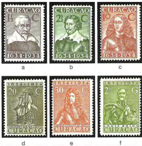
1934: 300 jaar Curaçao

Vreemd genoeg waren er vijf portretten (met namen) te zien plus een postzegel met een schip erop, met de tekst 'Johannes van Walbeek'.