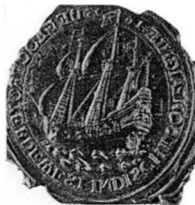
W. I. C. wapen

Inderdaad lijken beide afbeeldingen goed op elkaar.