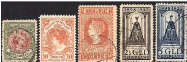
Achtereenvolgens de NVPH-nummers 48, 80, 101, 130 en 131, behorende tot de categorie duurdere zegels van Nederland

De postzegelverzamelaars van nu zijn veelal op jonge leeftijd gestart met het verzamelen van Nederland. Al dan niet aangevuld met de overzeese gebieden. Totdat een punt bereikt wordt dat alleen de vakjes van de meest dure zegels leeg blijven. Het geldt om deze ontbrekende zegels aan te schaffen is er niet of is er niet voor over. Maar dan, het verzamelvirus zit toch in het bloed.