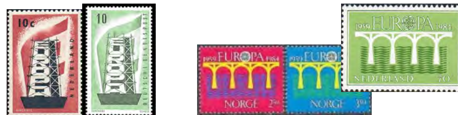
1956-1959: Europese gemeenschap voor Kolen en Staal

In internationaal verband worden, gezamenlijk met een of meerdere landen, postzegels uitgegeven met een gemeenschappelijk doel. Meest bekende uitgiften van dit soort postzegels zijn de Europa postzegels. De coördinatie van de uitgifte van Europazegels lag in de loop der tijd bij drie verschillende organisaties: