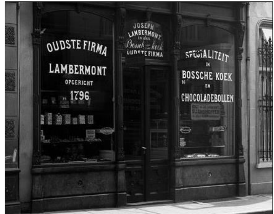
Afb.4: De winkel van banketbakker Lambermont, Visstraat 16, ca. 1930.

Dat neemt niet weg dat het Museum, inclusief workshop, 'belevenis', museumwinkel en stadswandeling, een initiatief is van banketbakker Jules Lauwerijssen, de eigenaar van bakkerij Royal in de Visstraat. De Bossche Bol