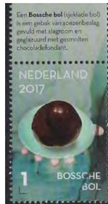
uit Maandblad van de 's-Hertogenbossche Filatelistenvereniging