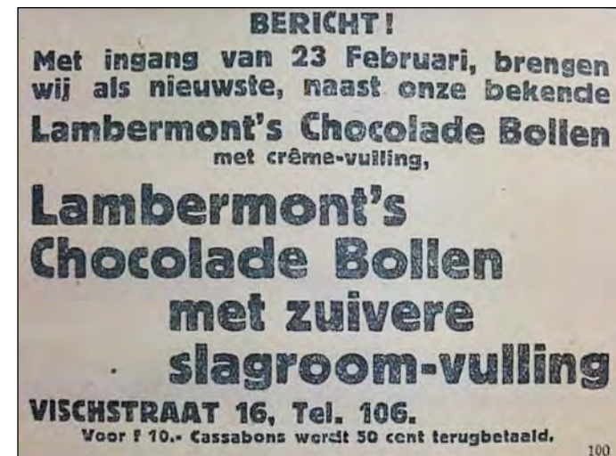
Afb. 5: Advertentie van banketbakker Lambermont uit februari 1924.