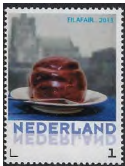
Filafair 2013. Met de Sint-Jan vaag op de achtergrond,