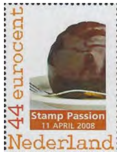
Stamp Passion 2008