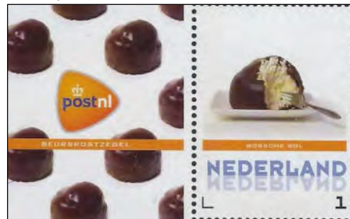
Beurspostzegel Filafair 2013