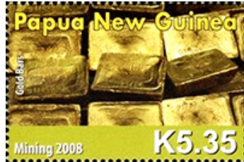
Overall ter wereld kan goud worden aangetroffen

De goudstandaard kwam onder druk te staan in de jaren '60 en '70 van de 20e eeuw. Frankrijk begon in die tijd haar dollarreserves om te zetten in goud, wat de Amerikaanse goudreserves onder druk zette. De kosten van de Vietnamoorlog en de groeiende inflatie in de VS verergerden de situatie.