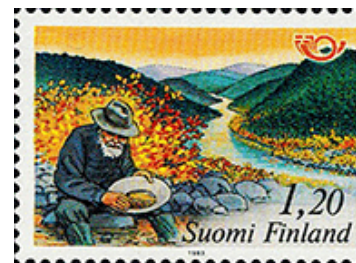
Op zoek naar goud

inwonertal van de plaatsen Dawson en Klondike steeg in 1898 tot 30.000 inwoners, waardoor er zelfs hongersnood dreigde. Er is nog steeds goud te vinden in de omgeving van Dawson City, maar de individuele goudzoekers zijn vervangen door grote bedrijven die nog steeds goud delven in het Klondike-district.