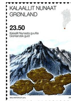
Trump is vooral uit op de bodemschatten van Groenland

Goud ontstaat door extreme kernfusiereacties in het heelal, voornamelijk bij supernova-explosies en botsingen van neutronensterren, waar zware elementen worden gevormd. Dit goud werd in de ruimte geslingerd en kwam bij de vorming van de aarde