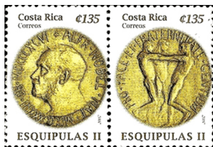
De Nobelprijs voor de vrede omvat onder andere een gouden medaille

Naast de functionele toepassingen van goud blijft het edelmetaal een belangrijk cultureel symbool. Het wordt gebruikt bij de vervaardiging van prijzen en onderscheidingen, zoals Olympische medailles en de Nobelprijs. Ook in religieuze en ceremoniële objecten speelt goud nog steeds een prominente rol. De veelzijdigheid en blijvende aantrekkingskracht van goud maken het een unieke grondstof die zowel economische als culturele waarde heeft. Terwijl de technologie en markten zich blijven ontwikkelen, blijft goud een constante factor, een metaal dat zijn waarde door de millennia heen heeft behouden en waarschijnlijk zal blijven behouden.