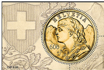
Het Zwitserse goud is het meest zuivere ter wereld, geraffineerd tot 99,9 %

spelen in de wereldwijde economie. Het wordt nog steeds gezien als een veilige haven in tijden van economische onzekerheid en een betrouwbare belegging. Centrale banken over de hele wereld blijven aanzienlijke hoeveelheden goud aanhouden als onderdeel van hun reserves. De geschiedenis van de goudstandaard benadrukt de blijvende waarde van goud en de complexe relatie tussen dit edelmetaal en de wereldeconomie.