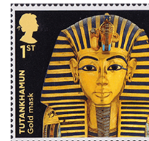
Dodenmasker van Farao Tutanchamon

eerste beschavingen die goud op grote schaal gebruikten. Rond 3000 v.Chr. begonnen zij het metaal te gebruiken voor sieraden, grafgriften en religieuze voorwerpen. De beroemde maskers van farao's, zoals het masker van Toetanchamon, getuigen van de uitgebreide en verfijnde goudsmeedkunst in het oude Egypte. In het oude Mesopotamië werd goud gebruikt voor het vervaardigen van prachtige kunstvoorwerpen en