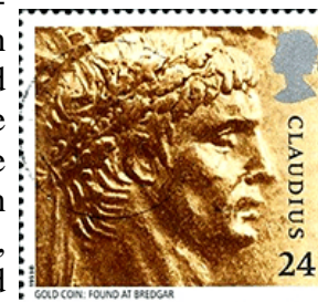
Gouden Romeinse munt

De invoering van de goudstandaard markeerde een cruciaal moment in de economische geschiedenis. De goudstandaard is een monetair systeem waarbij de waarde van een land's valuta direct gekoppeld is aan een specifieke hoeveelheid goud. Dit systeem werd in de 19e eeuw ingevoerd om stabiliteit te brengen in de internationale handel en de waarde van munten te uniformeren. In 1821 was het Verenigd Koninkrijk het eerste land dat officieel de goudstandaard aannam. Dit betekende dat de Bank of England verplicht was om goud te kopen en verkopen tegen een vaste prijs in ponden, waardoor de waarde van de munt gegarandeerd werd door de goudreserves. Andere landen volgden snel, waaronder Duitsland, Frankrijk en de Verenigde Staten. Deze landen koppelden hun valuta aan goud, wat leidde tot een gestandaardiseerd internationaal systeem dat de handel vergemakkelijkte en valutawisselkoersen stabiliseerde.