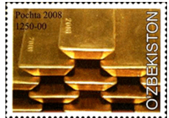
Goudstaven ofwel 'broodjes'

In de moderne tijd blijft goud een belangrijke en veelzijdige grondstof met een breed scala aan toepassingen. Het wordt nog steeds hoog gewaardeerd om zijn schoonheid en duurzaamheid, wat het een populaire keuze maakt voor sieraden. Maar goud heeft vandaag de dag veel meer functies dan alleen decoratieve.